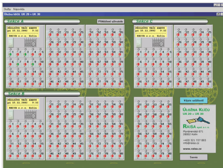
Obr. 4 Hlavní obrazovka vizualizace

Software umožňující pohodlné ovládání úložen klíčů UK 20 a UK 30 včetně jejich programování a monitorování